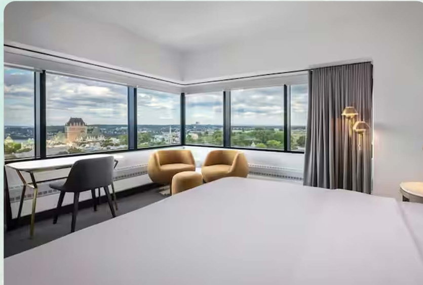
Hôtel Hilton : 296 USD + taxes / La nuitée