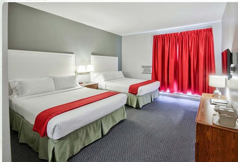
Hotel du Nord : 160 USD + taxes / La nuitée