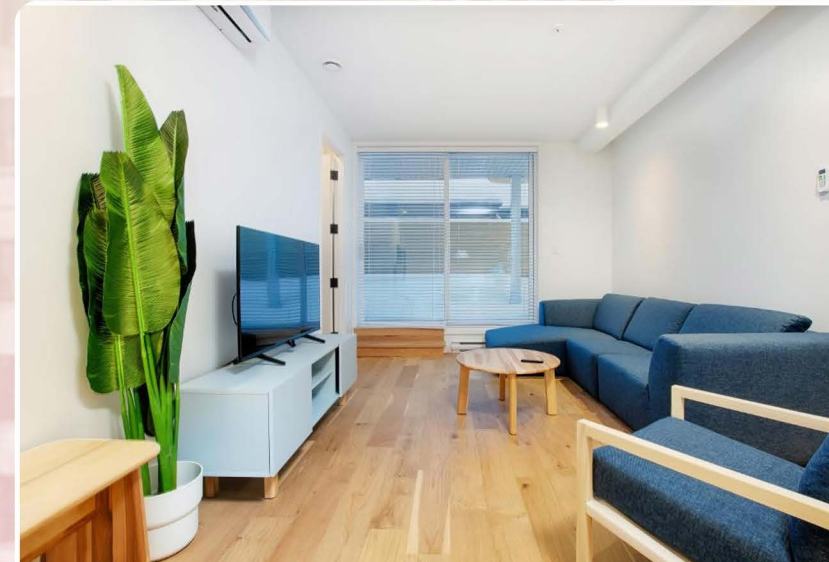
Les lofts St François : 200 USD + taxes / La nuitée

Siège social : 1173 Boulevard Charest Ouest, p 233 Québec (Qc) Canada || Bureau de Montréal : 257 Rue Sherbrooke Est, Montréal, QC, H2X 1E3, Canada. Tel : +1 (581) 986 6322/+1 438 873 8603; Email : Infos@chaqua.org; Site web : www.chaqua.org