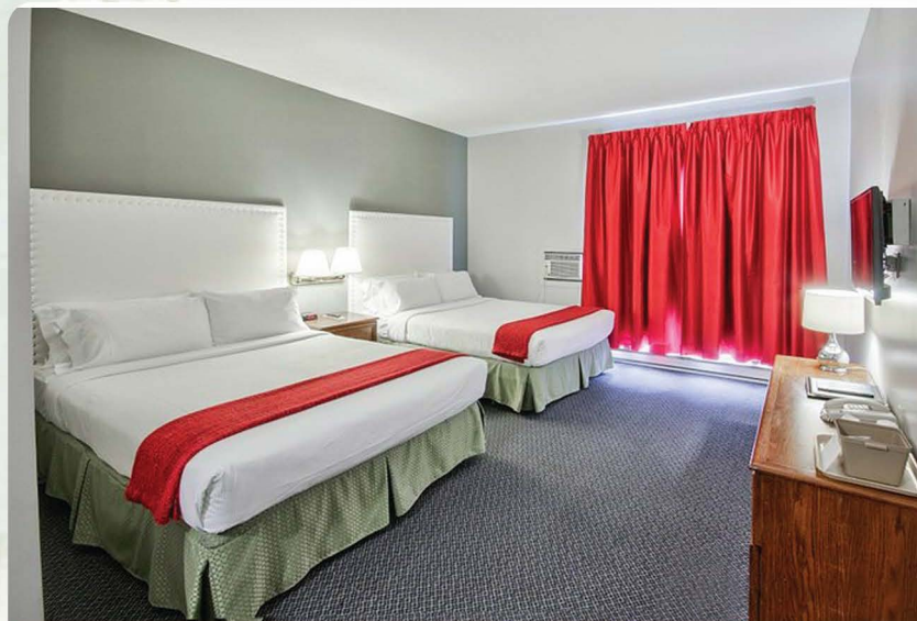
Hotel du Nord : 100 000 Fcfa + taxes / La nuitée