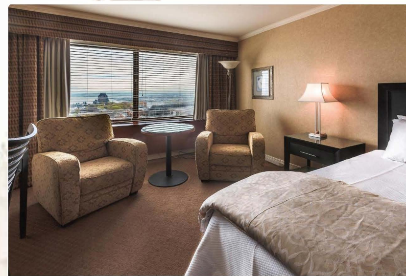
Hotel le concorde : 109 000 Fcfa + taxes / La nuitée