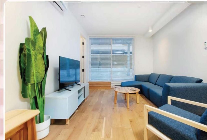
Les lofts St François : 125 000 Fcfa + taxes / La nuitée

Siège social : 1173 Boulevard Charest Ouest, p 233 Québec (Qc) Canada || Bureau de Montréal : 257 Rue Sherbrooke Est, Montréal, QC, H2X 1E3, Canada. Tel : +1 (581) 986 6322 / +1 438 873 8603; Email : Infos@chaqua.org; Site web : www.chaqua.org