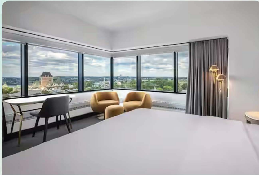
Hôtel Hilton : 184 500 Fcfa + taxes / La nuitée